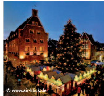
Gemütliches Weihnachtsdorf rund ums Kiepenkerl-Denkmal.

Wenn der Prinzipalmarkt golden leuchtet, die Bogengänge mit Adventskränzen geschmückt sind, der Duft von Glühwein und gebrannten Mandeln durch die Straßen zieht und die Geschäfte festlich dekoriert sind, beginnt in Münster die wohl schönste Zeit: Fünf Weihnachtsmärkte öffnen ihre Tore und verwandeln Münsters Altstadt in ein Wintermärchen. Auf dem zentral gelegenen Schlossplatz, wenige Gehminuten von den Weihnachtsmärkten entfernt, stehen in der Adventszeit bis zu 130 Busparkplätze zur Verfügung. Jeder Fahrgast erhält einen kostenlosen Stadtplan, auf dem alle fünf Weihnachtsmärkte ausgewiesen sind. Jeder Busfahrer erhält einen Essensgutschein im Wert von 5 Euro, der in drei Restaurants in der Nähe des Schlossplatzes eingelöst werden kann. Das Gesamtpaket kostet für einen ganzen Tag von Sonntag bis Freitag 20 Euro und am Samstag 25 Euro pro Bus. In diesem Preis sind alle oben angeführten Leistungen enthalten.