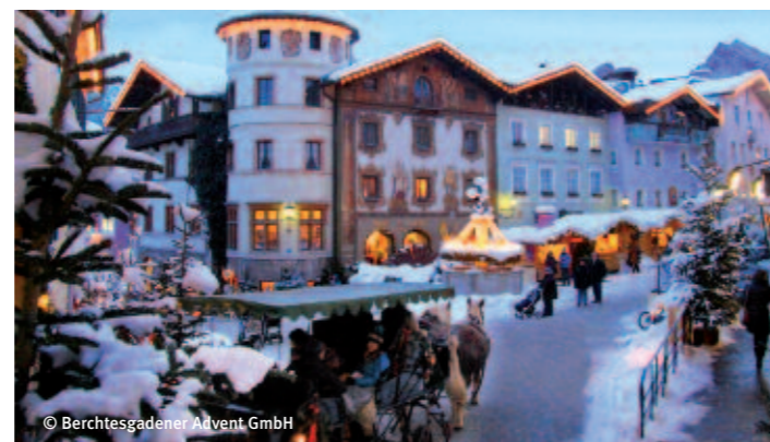
Eingerahmt von Watzmann und königlichem Schloss versetzt der Berchtesgadener Advent in entspannte vorweihnachtliche Stimmung.

Ein besonderer Zauber liegt über dem historischen Ortskern von Berchtesgaden in der Adventszeit. Ein Adventsmarkt, der mit viel Handwerk und lebendiger Tradition an früher erinnert. Ein vielfältiges Rahmenprogramm erwartet täglich die Besucher: traditionelle Weisen mit Bläser- und Gesangsgruppen und Hirtenspiele hüllen den Berchtesgadener Advent in weihnachtliche Atmosphäre. Sehr beliebt sind die kostenlosen Pferdekutschenfahrten oder ein Besuch in der Schmiede- und Schnitzwerkstatt. Ortsansässige Standbetreiber mit regionalen und traditionellen Produkten warten auf die Besucher, die hier noch etwas Besonderes und Einmaliges finden können. Tradition, Originalität und bodenständiges Handwerk in gefühlvoller Atmosphäre – das macht den Berchtesgadener Advent zu einem einzigartigen Erlebnis.